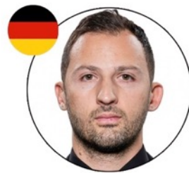
Доменико Тедеско Экс-тренер ФК «Спартак Москва»