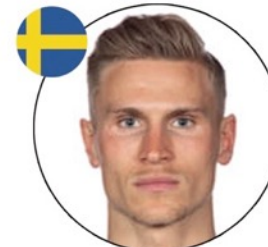
Карл Старфельт ФК «Селтик»