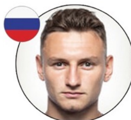
Федор Чалов ПФК «ЦСКА»